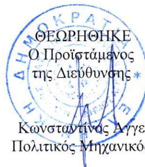
Κωνσταντίνος Αγγελάκης Πολιτικός Μηχανικός